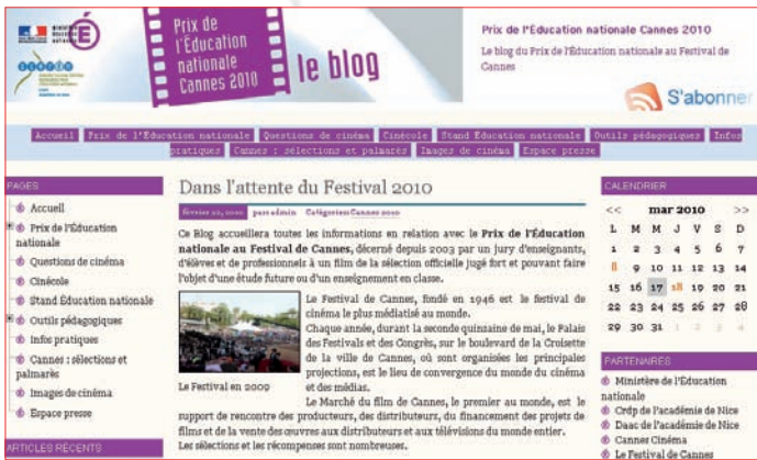
Blog du Prix de l'Éducation nationale 2010 - www.prix-education-cannes.fr édité par le CRDP pour le Ministère de l'Éducation nationale